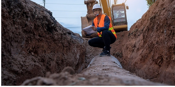
> Tiefbau: Kapellmann begleitet RAEDER bei Übernahme durch TERRAS