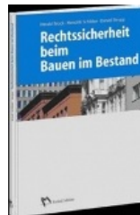
› Rechtssicherheit beim Bauen im Bestand