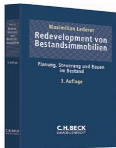
› Redevelopment von Bestandsimmobilien