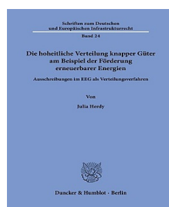
› Die hoheitliche Verteilung knapper Güter am Beispiel