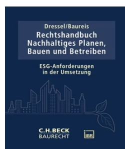
› Rechtshandbuch Nachhaltiges Planen, Bauen und Betreiben