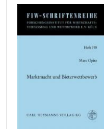
> Marktmacht und Bieterwettbewerb