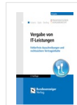
> Vergabe von IT-Leistungen