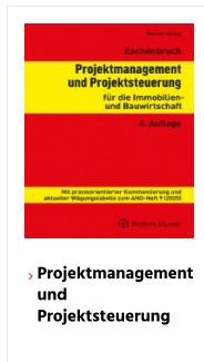
› Projektmanagement und Projektsteuerung