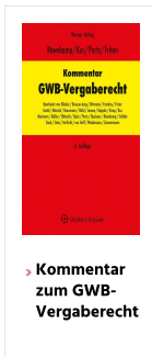
› Kommentar zum GWB-Vergaberecht