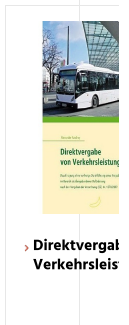
› Direktvergal Verkehrsleis