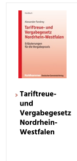
› Tariftreue- und Vergabegesetz Nordrhein-Westfalen