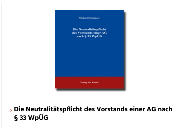
> Die Neutralitätspflicht des Vorstands einer AG nach § 33 WpÜG