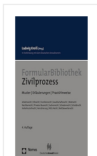
> Formular Bibliothek Zivilprozess