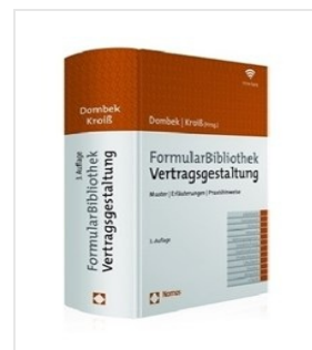
> FormularBibliothek Vertragsgestaltung - Privates Baurecht