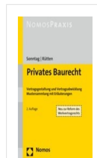
> Privates Baurecht