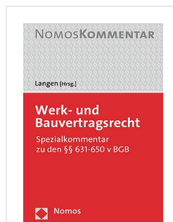
> Werk- und Bauvertragsrecht